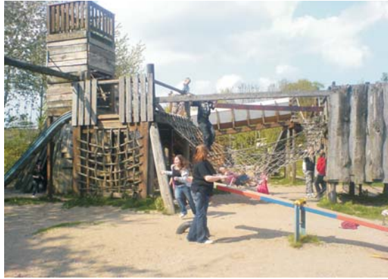
Jugendbauernhof Mettenhof - Abenteuerspielplatz