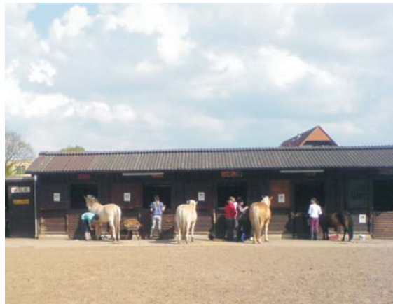
Jugendbauernhof Mettenhof - Ponyreiten